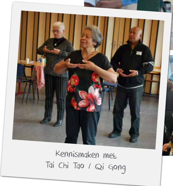
Kennismaken met Tai Chi Tao / Qi Gong