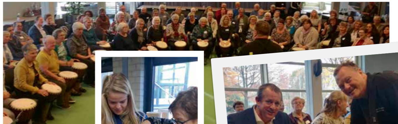
“En zo goed verzorgd door de studenten van het Alfa-college”