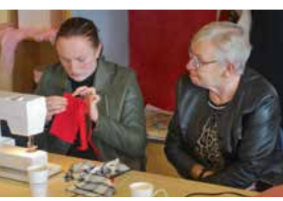
“Wat een heerlijk ontspannen dagje weer”